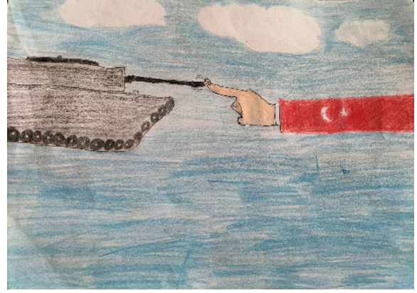
BERAT ABLAY -4/A