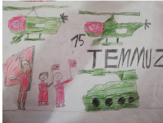
MUHAMMED DOLU -3/A