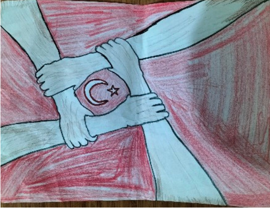
ALİ TUĞRA ÇELİK -4/A